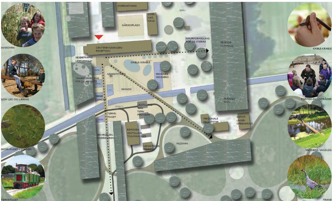
Billederne her er fra den udarbejdede masterplan.